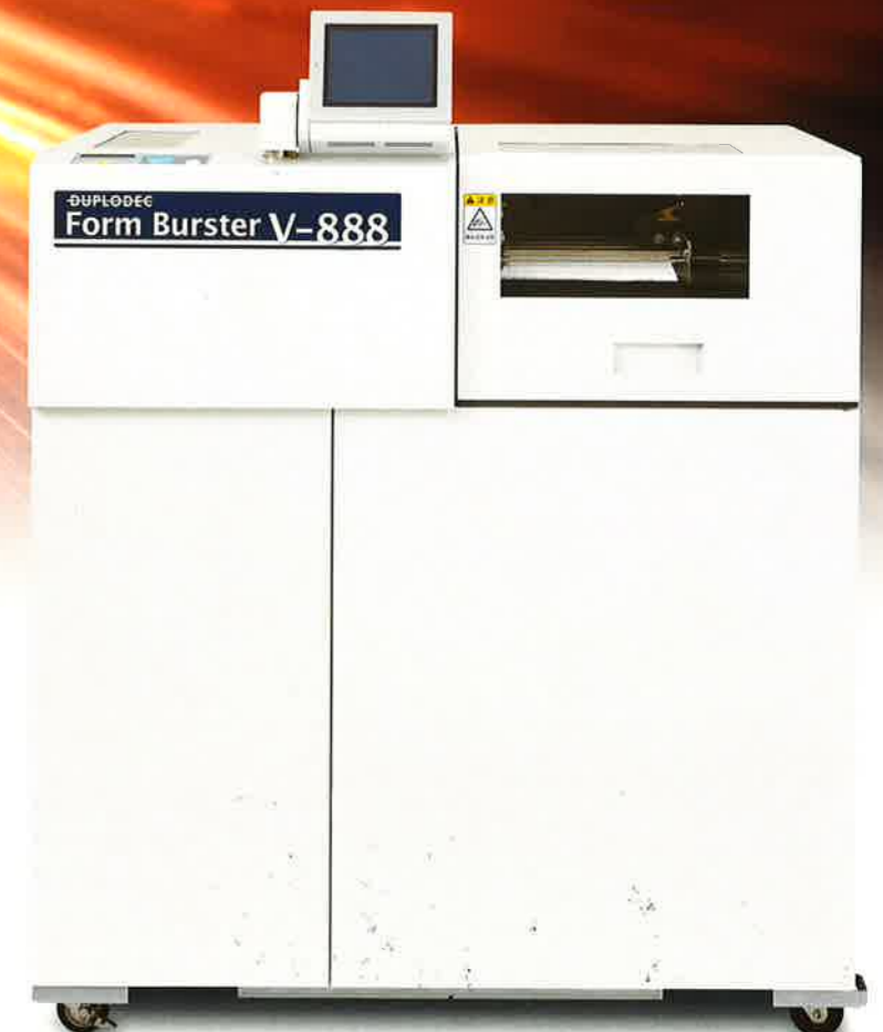
連続フォームバスター V-888